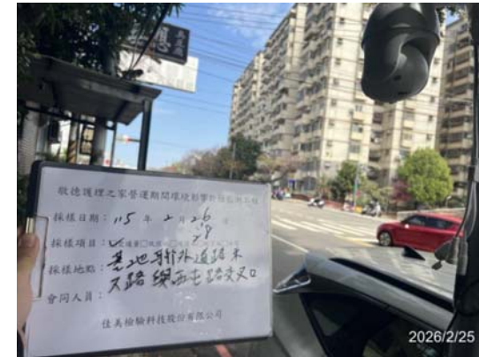
(東大路與西屯路口)