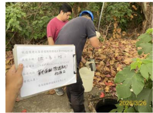
(基地南側(敬德街)放流口)