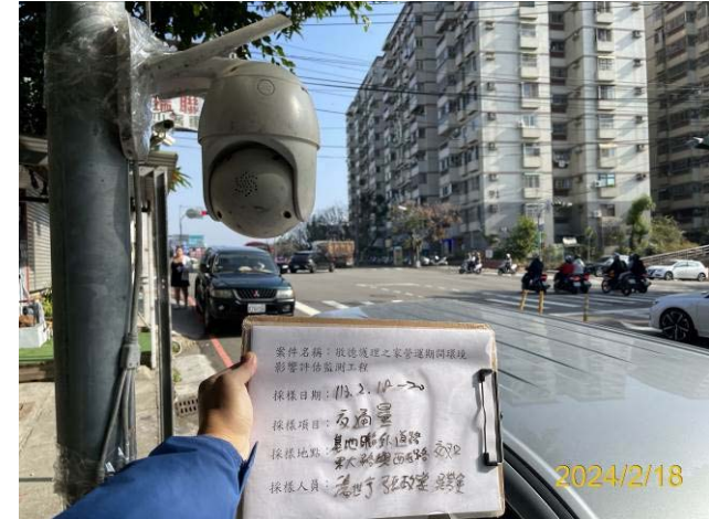
(東大路與西屯路口)