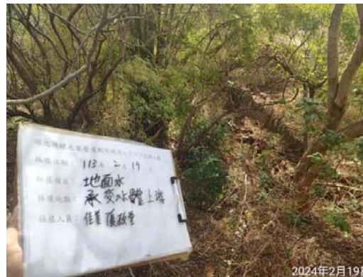
(承受水體上游 無水狀態)