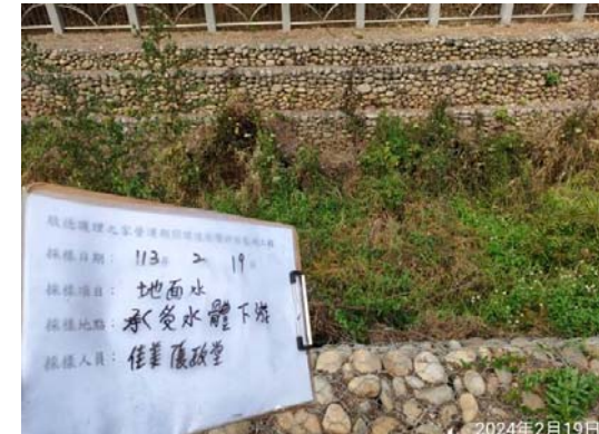
(承受水體下游 無水狀態)