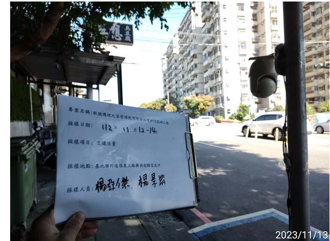
(東大路與西屯路口)