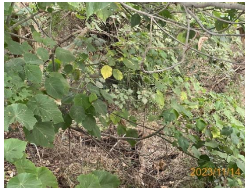
(承受水體上游 無水狀態)