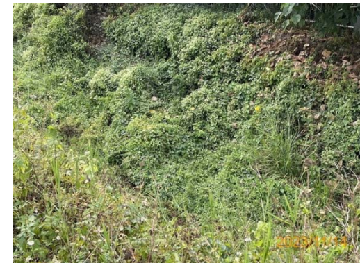
(承受水體下游 無水狀態)