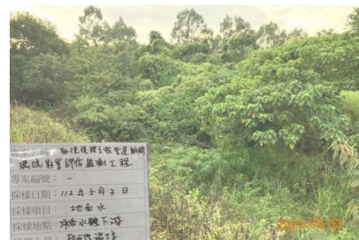
(承受水體下游 無水狀態)