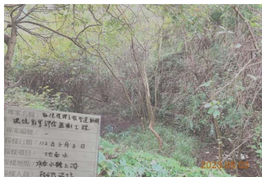
(承受水體上游 無水狀態)