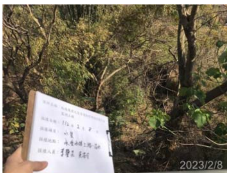
(承受水體上游 無水狀態)