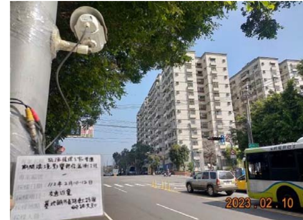
(東大路與西屯路口)