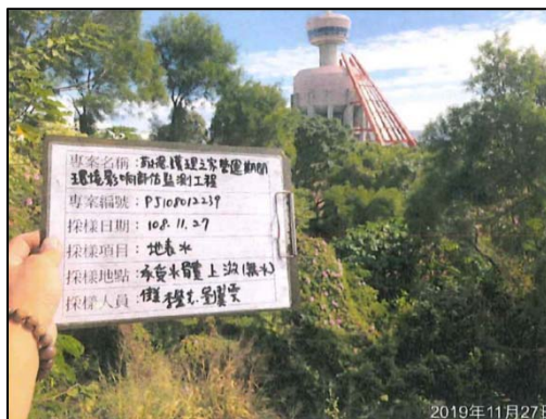
(承受水體上游 無水狀態)