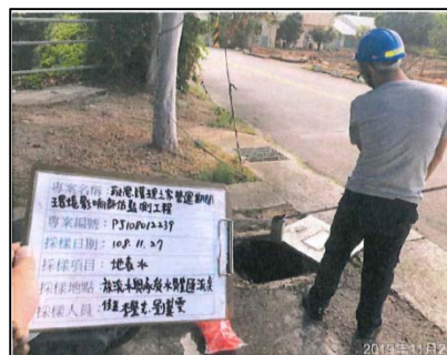
(放流水與承受水體匯流點)