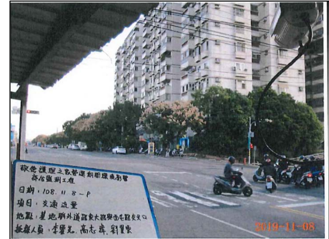
(東大路與西屯路口)