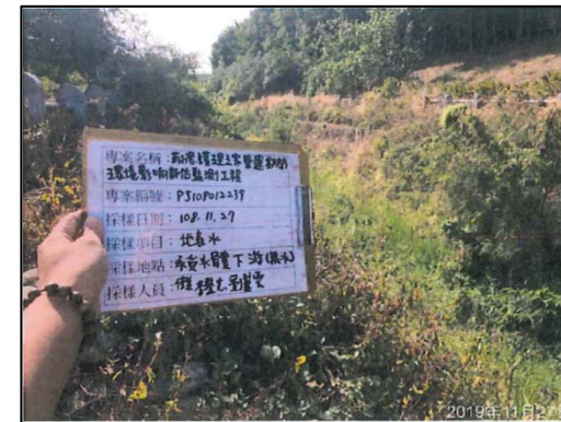
(承受水體下游 無水狀態)