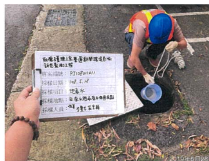
(放流水與承受水體匯流點)