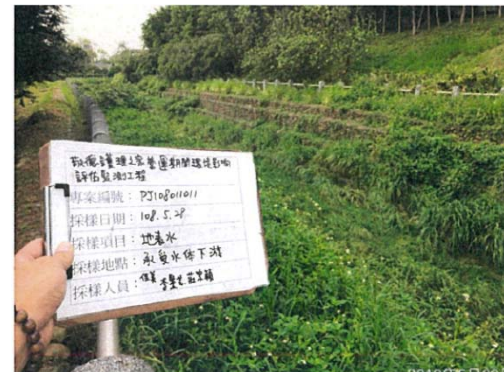
(承受水體下游 無水狀態)