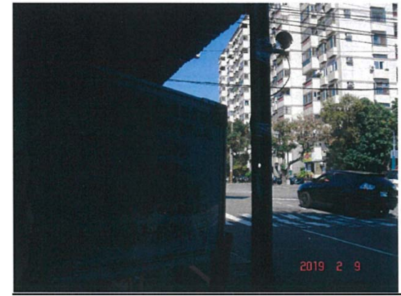
(東大路與西屯路口)