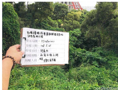
(承受水體上游 無水狀態)