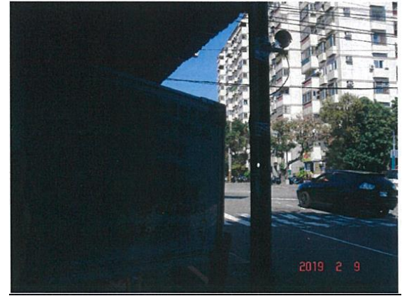
(東大路與西屯路口)