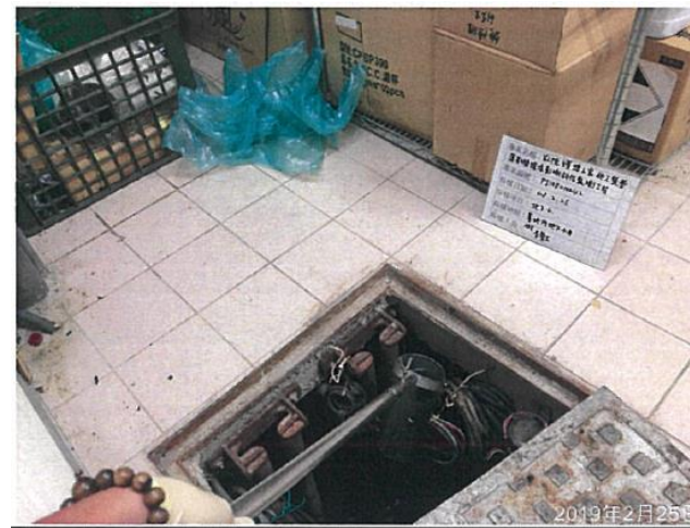
( 基地內地下水井 )