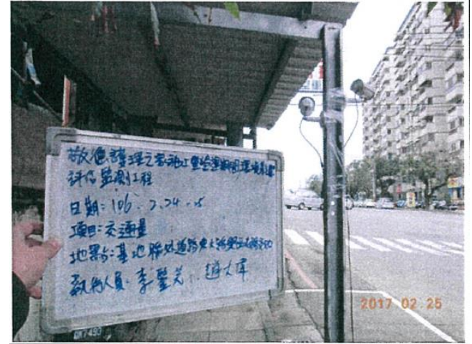
(東大路與西屯路口)