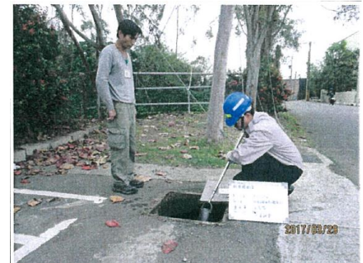
(放流水與承受水體匯流點)