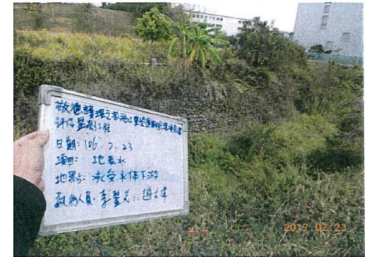
(承受水體下游 無水狀態)