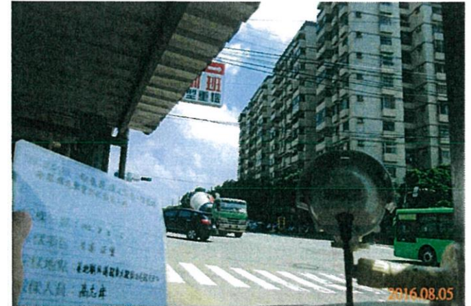
(東大路與西屯路口)