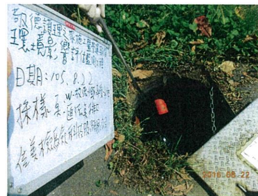
(放流水與承受水體匯流點)