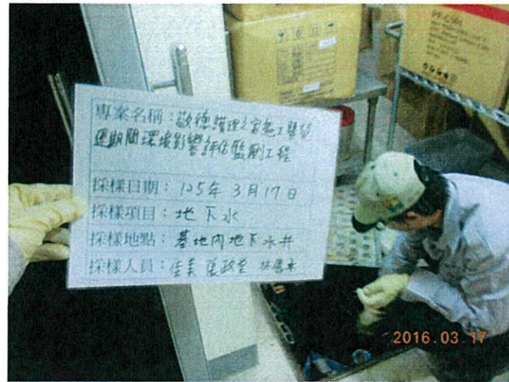
( 基地內地下水井 )