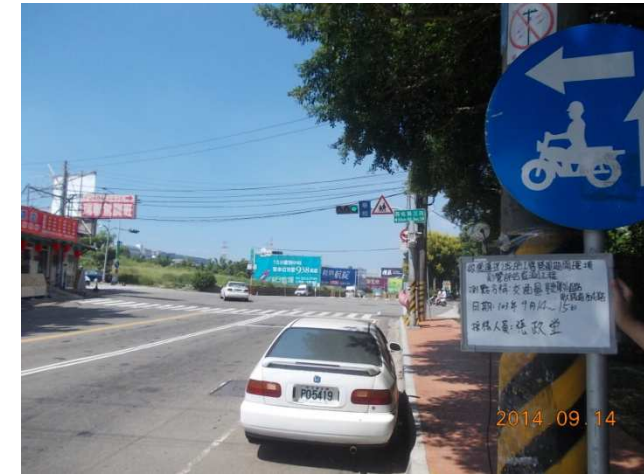
(東大路與西屯路口)