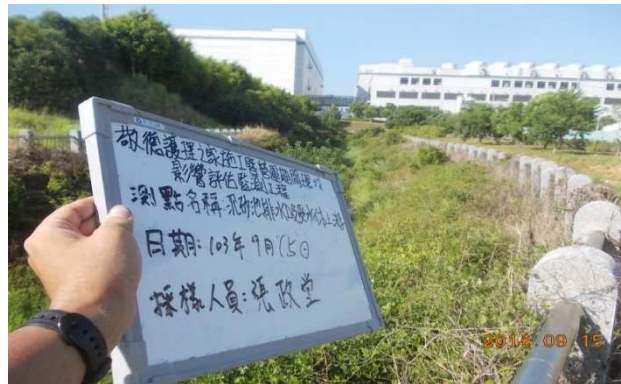
(承受水體上游無水情形)