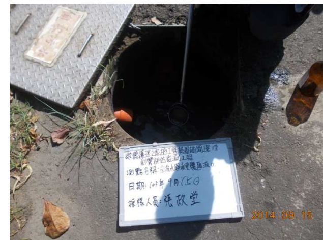
(放流水與承受水體匯流點)