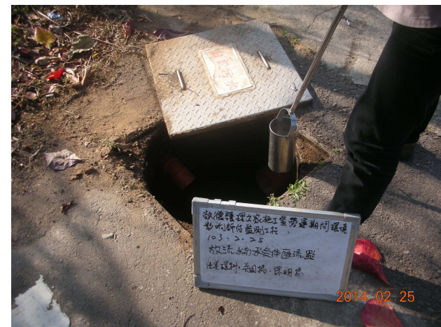
(放流水與承受水體匯流點)