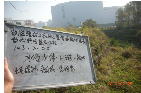
(承受水體下游無水情形)