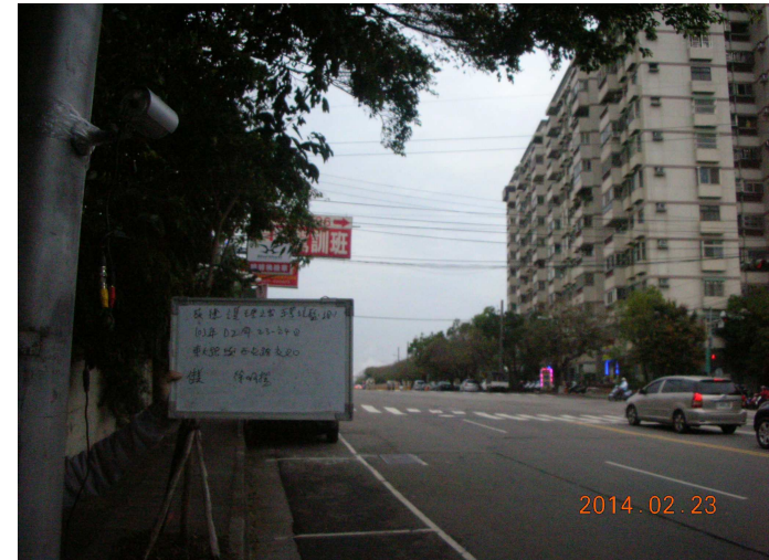
(東大路與西屯路口)